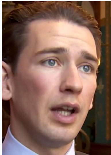
Sebastian ("Basti") Kurz, Boss der Bande. Auch "der Schweiger" genannt, schickt seinen Gehilfen Strache vor, hat es aber selber faustdick hinter den Ohren